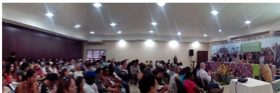
Encontro Regional de Cuiabá-MT (12-15/8/2014).